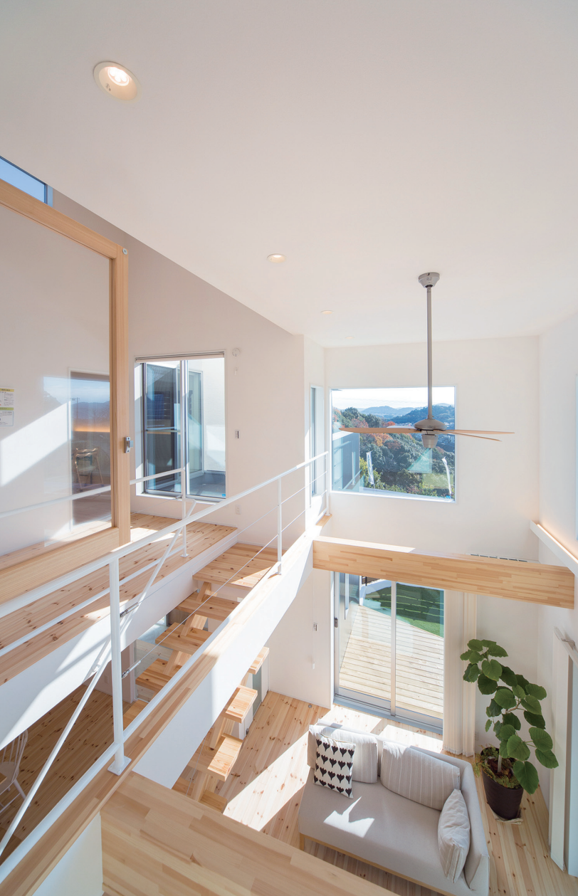
吹き抜け上部にはめ殺しのハイサイドライトを設置し、1日を通じて明るく快適なリビングを実現【酒井建設】

イドライトがあれば吹き抜けとつながる2階も見晴しがよくなり、圧迫感を解消します。リビングに階段を設置すれば、リビングがコミュニケーションスペースとなり、自然と家族が集い、会話が弾むリビングが実現するでしょう。